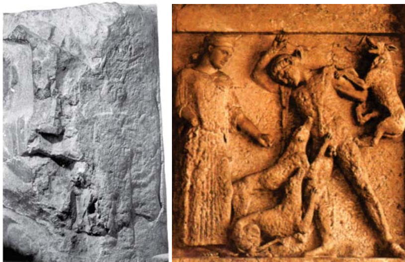
Slika 2: (levo) Enostavna upodobitev Actaeona na stranici nagrobnika iz Črnomlja. Spremenjenega v jelena ga napada pes, ki mu grize levo roko. (iz Šašel Kos, Marjeta: Cernunnos in Slovenia? Arheološki vestnik 61, 2010, str. 176). (desno) Upodobitev iz templja E iz Selina na Siciliji. Actaeona napadajo njegovi psi. Najbolj očitna podobnost je pes, pred katerim se napadeni brani z levico.

kot edina dovoljena vera cesarstva pa s solunskim ediktom leta 380, je bilo poudarjeno knjižna vera, v katere jedru je bilo Sveto pismo. Zgodnje krščanstvo je doseglo ozemlje današnjega Metliškega v času 4. stol. najverjetneje iz kolonije Siscia (današnji Sisak), kjer je izpričana skupnost že vsaj 309, ko je imela prvega mučenika, sv. Kvirina, ozemlje Bele krajine pa je bilo tedaj najverjetneje tudi administrativno zajeto v provinco Savia s središčem v Sisciji. Najzgodnejše priče prisotnosti krščanstva so ostanki dveh zgodnjekršćanskih cerkva na osamelcu Kučar nad Podzemljem, postavljenih okoli leta 380, 4 ki dopuščata možnost prisotnosti višjega cerkvenega uradnika, mogoče celo škofa. Cerkev pa je imela tudi utrjena poznoantična naselbina v Črnomlju. Ob tem je nasporna prisotnost duhovščine, torej posameznikov z vsaj osnovnim teološkim znanjem. Napisov iz tega obdobja nimamo, krščanski grobovi najdeni ob bregu reke Lahinje niso imeli epitafov, kot jih najdemo na zgodnejših grobovih iz 3. stol. in prej.